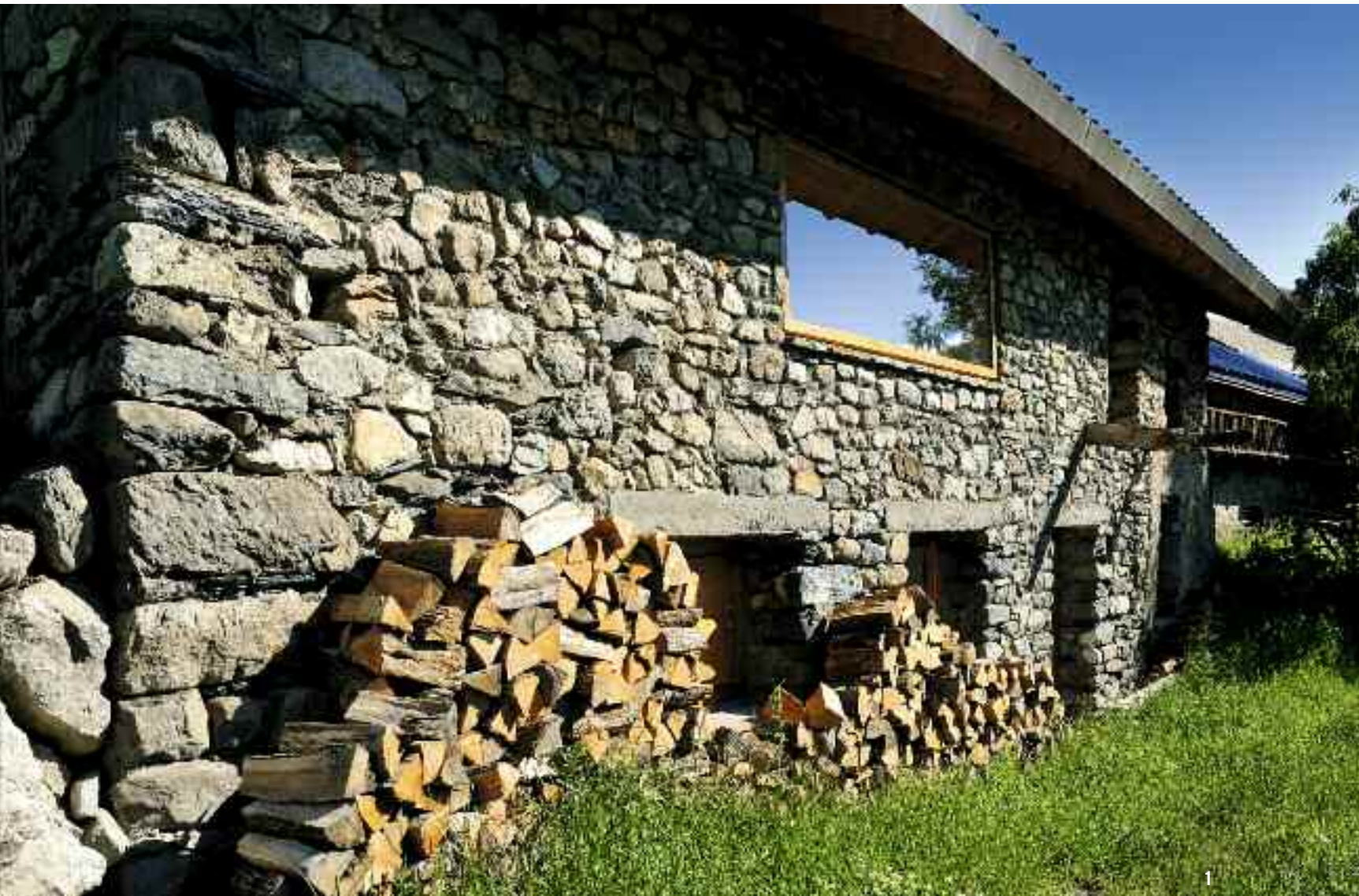
1. SUR LA COUPE, LE VOLUME DESSINÉ AU TRAIT EST UNE CAVE INDÉPENDANTE ACCOLÉE À L'EST DE LA MAISON. DANS LE PROJET D'ORIGINE, LA PORTE D'ENTRÉE ÉTAIT VITRÉE POUR PROFITER AU MAXIMUM DE LA LUMIÈRE NATURELLE. APRÈS LA DÉMOLITION DES MURS NORD ET OUEST, LES OUVERTURES SONT CONSERVÉES TELLES QUELLES. 2. LA CHARPENTE PORTIQUE SANS POINÇONS LIBÈRE DES MENUISERIES LE VOLUME DU SÉJOUR À L'ÉTAGE. LE RETOUR DE LA COUVERTURE ACIER EN PIGNON PROTÈGE LA CHARPENTE ET REHAUSSE LE DESSIN DU TOIT.