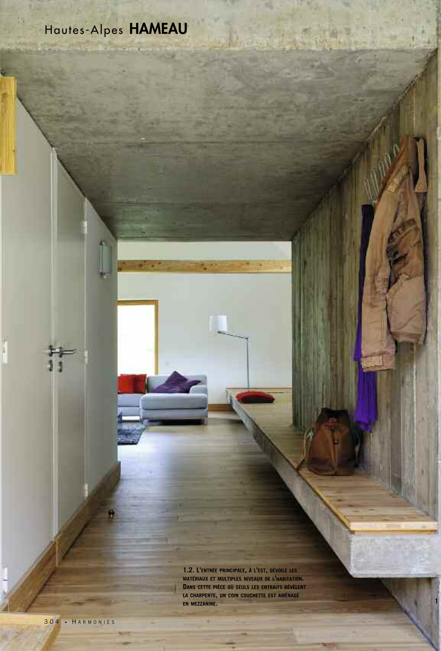
1.2. L'ENTRÉE PRINCIPALE, À L'EST, DÉVOILE LES MATÉRIAUX ET MULTIPLES NIVEAUX DE L'HABITATION. DANS CETTE PIÈCE OÙ SEULS LES ENTRAITS RÉVÈLENT LA CHARPENTE, UN COIN COUCHETTE EST AMÉNAGÉ EN MEZZANINE.