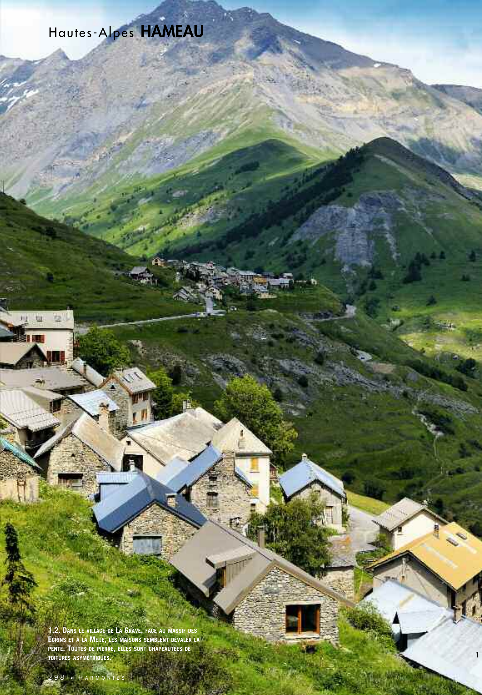
1.2. DANS LE VILLAGE DE LA GRAVE, FACE AU MASSIF DES ECRINS ET À LA MEJUE, LES MAISONS SEMBLENT DÉVALER LA PENTE. TOUTES DE PIERRE, ELLES SONT CHAPEAUTÉES DE TOITURES ASYMÉTRIQUES.