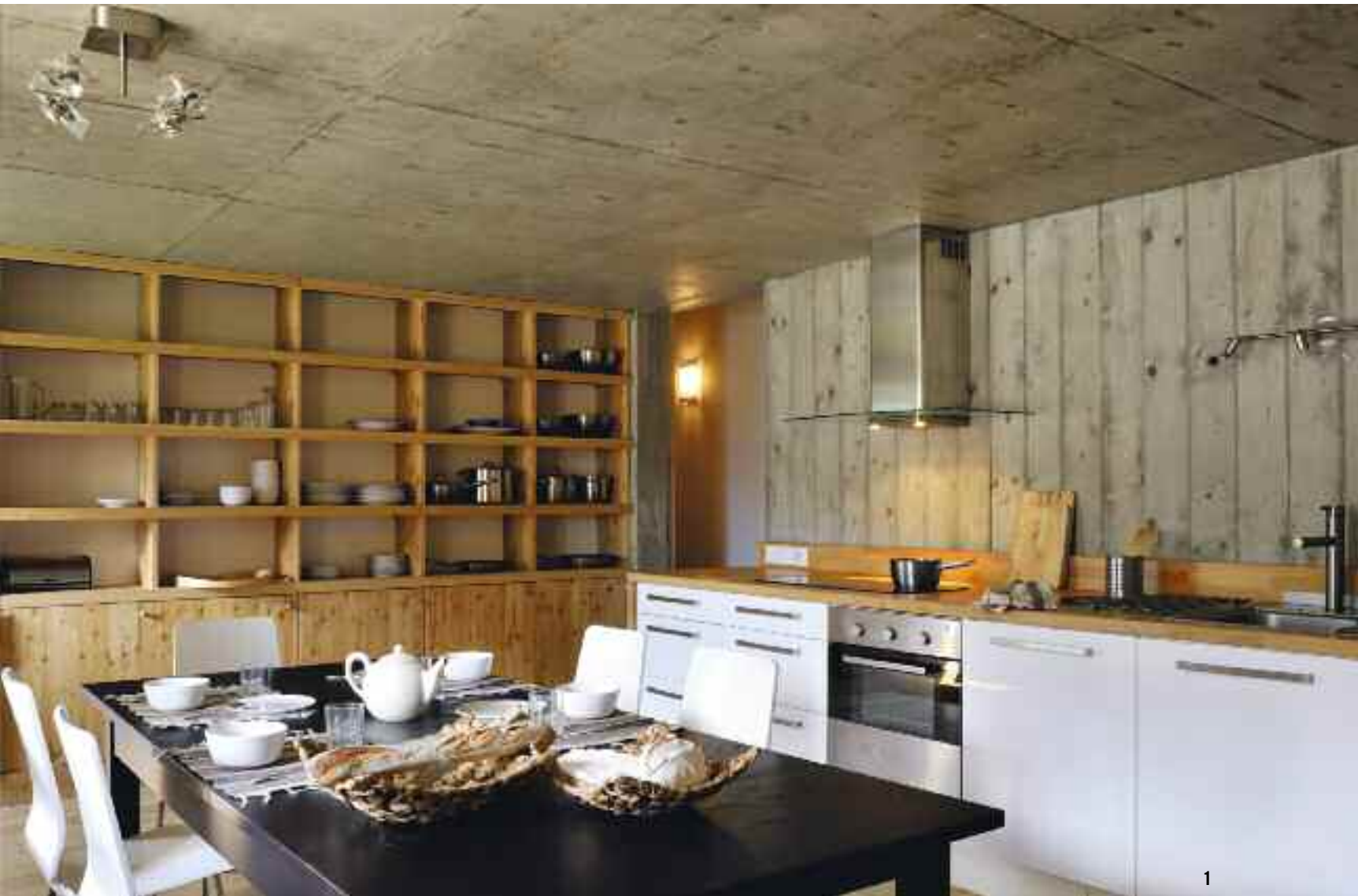
1. DANS LA CUISINE ET L'ENSEMBLE DU REZ-DE-JARDIN, LE BÉTON APPARAÎT LISSE EN SOUS-FACE DE LA DALLE, ET COFFRÉ À LA PLANCHETTE SUR LES PAROIS. 2.3. LE REZ-DE-CHAUSSÉE, AUTREFOIS LA PARTIE "ÉTABLE", ACCUEILLE AUJOURD'HUI LA CUISINE-SALLE À MANGER, À POÊLE INTÉGRÉ. CHAISES MAUI DE VICO MAGISTRETTI CHEZ KARTELL, EN ACIER ET POLYPROPYLÈNE.