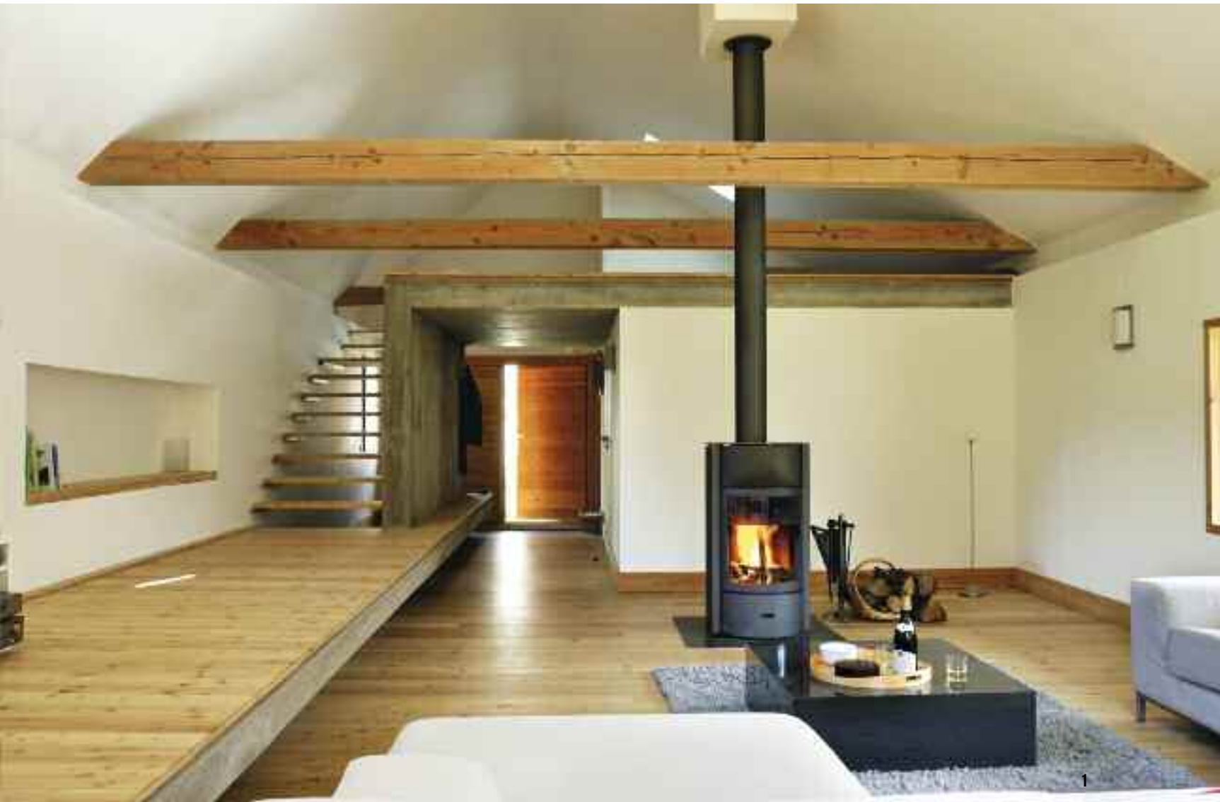
1.2. LE PREMIER NIVEAU EST DÉDIÉ À L'ESPACE À VIVRE, ÉCLAIRÉ DE TOUTES PARTS. BÉTON ET MÉLÈZE S'Y MÉLÈNT GRAPHIQUEMENT. LE POËLE PERMET À LUI SEUL DE CHAUFFER CET ÉTAGE.